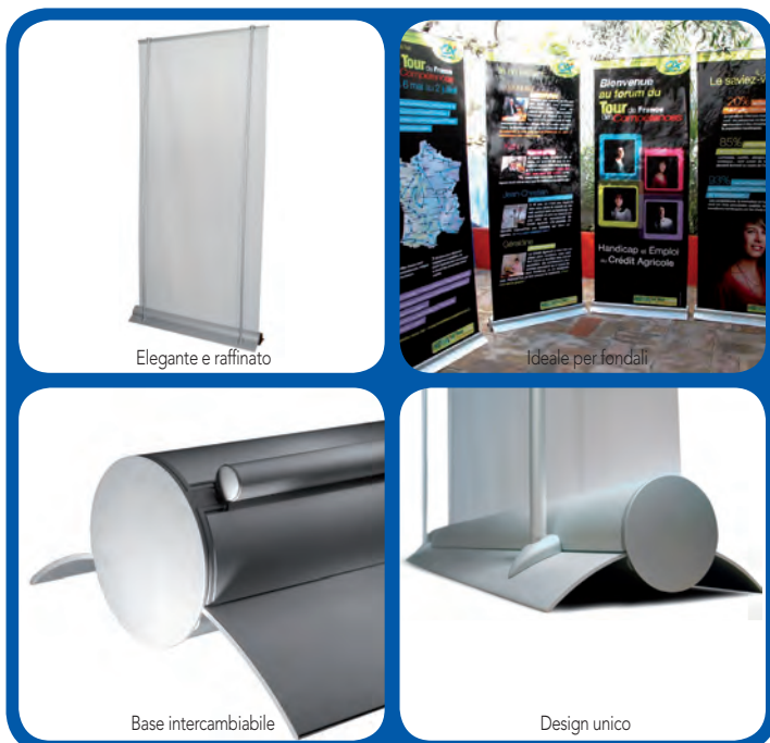
Elegante e raffinato

CHRONOROLL è un display di gran lusso e raffinatezza, contraddistinto da una base ultra compatta di soli 20 cm. Studiato per essere riutilizzabile all'infinito, a differenza dei normali roll up usa e getta presenti sul mercato, supporta indifferentemente sia il banner che il tessuto; in quest'ultimo caso è sufficiente cucire direttamente il tessuto sull'asola superiore del meccanismo a scatto. L'intercambiabilità delle grafiche è istantanea grazie ad un ingegnoso aggancio a serpentina; per sostituire più grafiche è necessario acquistare di volta in volta il PANEL REPLACEMENT KIT. Tutto è stato pensato nei dettagli, persino il meccanismo con la molla a scatto "CARTRIDGE" può essere sostituito per trasportare le grafiche in modo sicuro o sostituire un riavvolgitore eventualmente usurato.