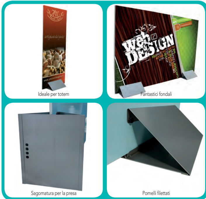
Ideale per totem

Semplice, affidabile, elegante: DELTAW è la soluzione entry level per la creazione di fondali e totem. Il peso di ben 13 Kg e la conformazione triangolare della struttura, consentono la creazione di fondali dalle elevate dimensioni, senza trascurare la sicurezza. Utilizzando due strutture DELTAW è possibile infatti creare fondali per un massimo di L 3 m x H 2 m, utilizzando supporti con spessore 20 mm. La verniciatura elegante in alluminio anodizzato consente un fascino senza eguali; si raccomanda di trattare con cura la superficie per evitare graffi.